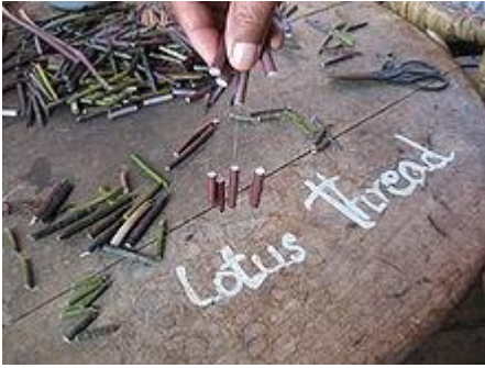
Lotus: viene utilizzato per tessere una tela speciale per vestire il Buddha.