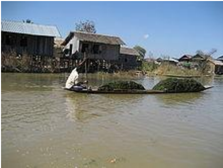
Raccolta delle erbe infestanti sul lago