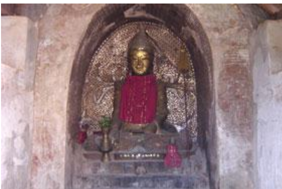
Gli Shan dedicati alla Buddismo nei tempi antichi.