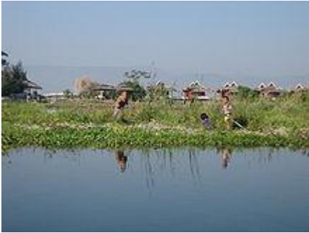
Azienda agricola sull'acqua