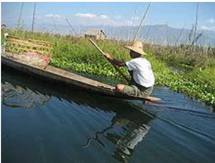
Beida (giacinto d'acqua) che intasa i piccoli canali