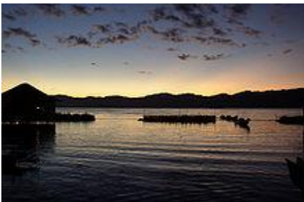
Tramonto sul Lago Inle