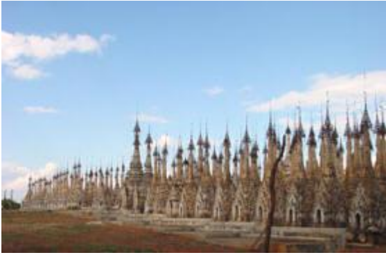
Una lunga serie di pagode a Kakku