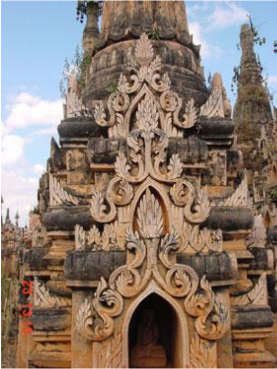
Decorazioni che mostrano le diverse architetture dei tempi antichi.