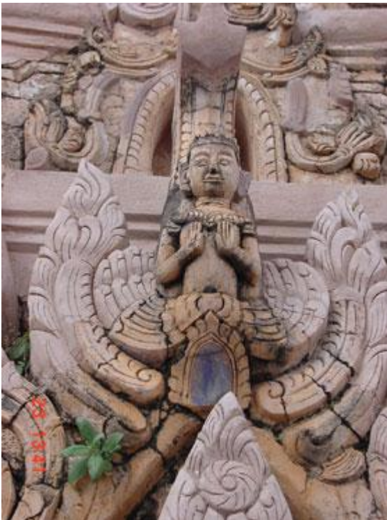
Scultura di un NAT o tutore spirito.