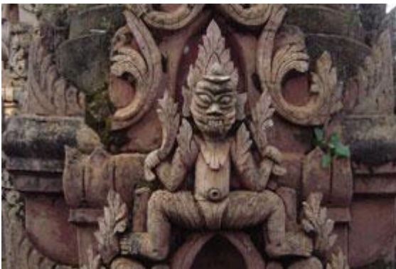
Sculture in legno ritrovate nelle pagode