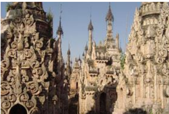
Pagode del passato costruite dal re Alaung Sithu