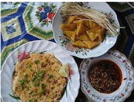
jin Htamin (riso fermentato) piatto popolare locale.